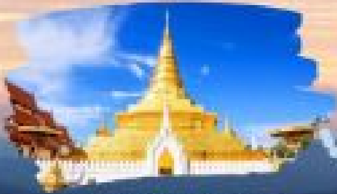
วัดพระธาตุเขาน้อย