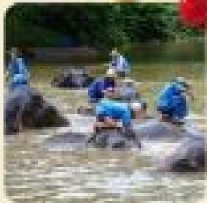
ชมป่ามฤตยูลำปาง