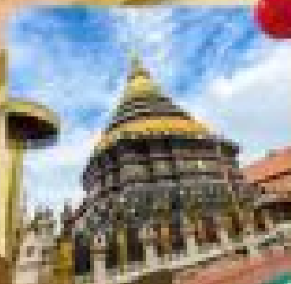
วัดพระธาตุลำปางหลวง