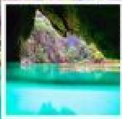
อุนเกาะรัง