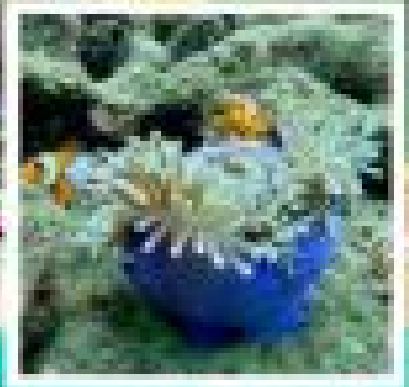
เรือวงเกาะ