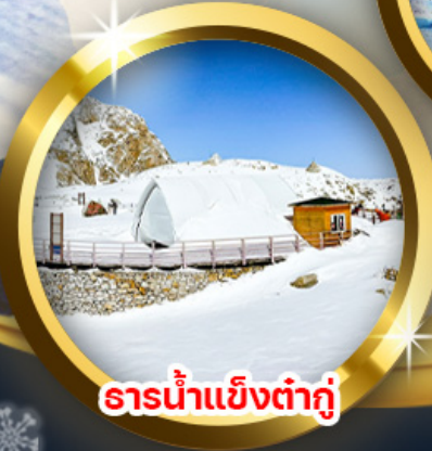
ธารน้ำแข็งต่ากู่