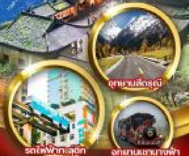
รถไฟฟ้าถ้ำลู่ตง