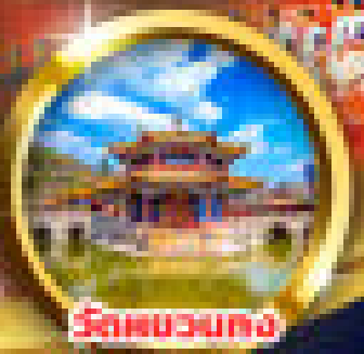
วัดชวงหนง