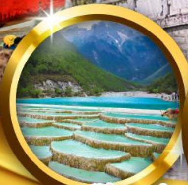
ทะเลสาบไ้สวยเห่อ