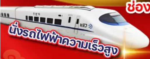
ขั้รถไฟฟ้าความเร็วสูง