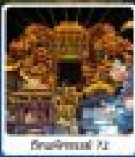
เมืองโบราณ 72