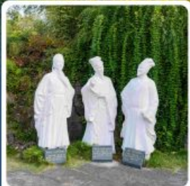
สวนท่าสามสหาย

• ไอลี่ อุกยานเขาบู๊ตัง ขึ้นกระเช้าสู่ยอดเขาจินตัง โซวไท่เท็กสุดอลังการ เมืองโบราณเซียงหยาง หมู่บ้านซานเสี่ยเหรินเจีย สวนท่าสามสหาย