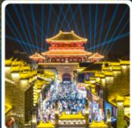
เมืองโบราณเซียงหยาง