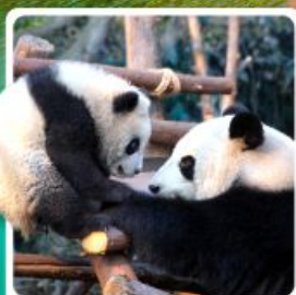
หุบเขาแพนด้าตู่เจียงเอี้ยน