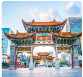
ประตูน้ำทองไถ่หยก