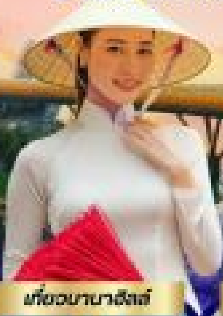
เมืองบานาวิลส์