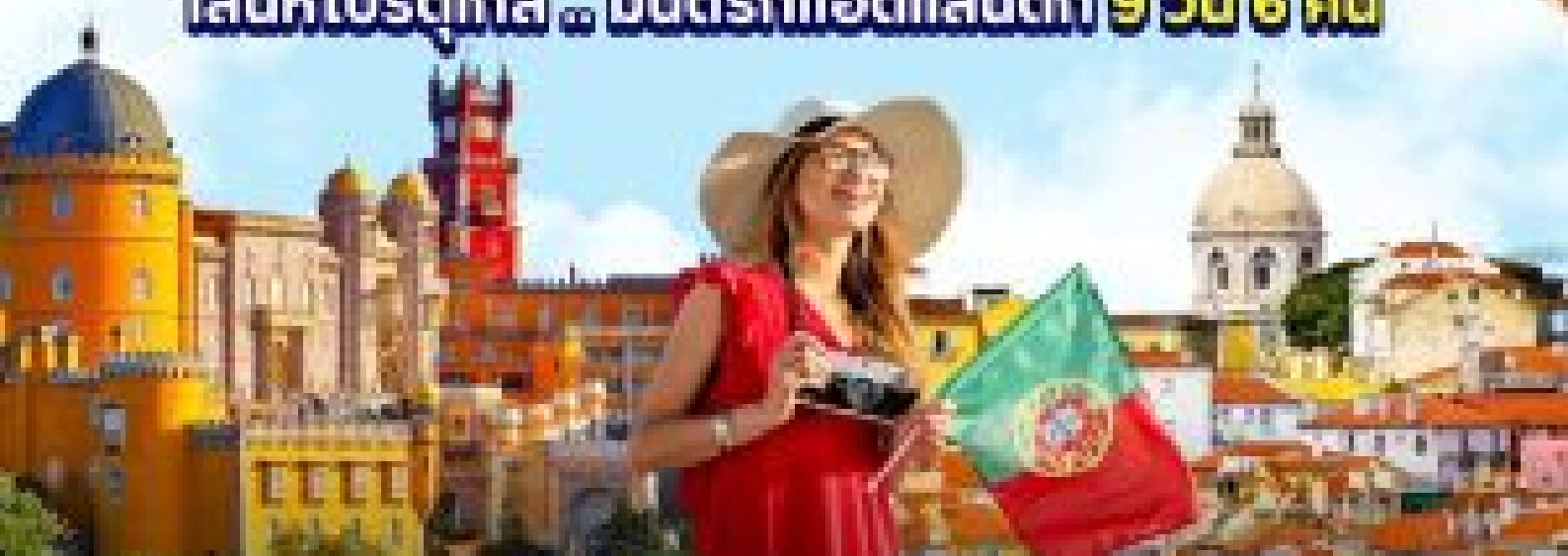
เที่ยวกรุงลิสบอน