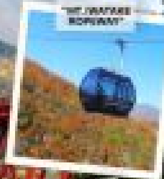
"THE WAKAYE KOPPAT"