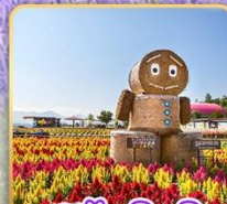
สวนซึกิไซโซะโอะกะ