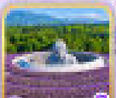
ชมวิถีชีวิตริมน้ำ