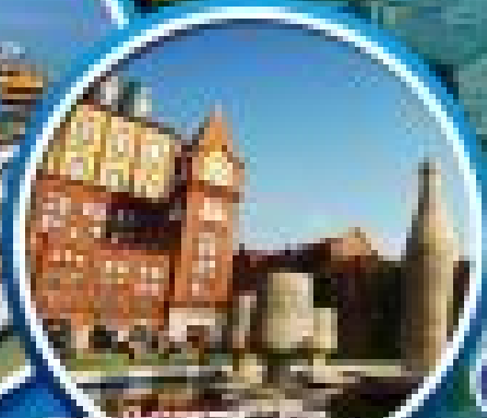
โปรแกรมพิเศษ

02-007-6668, 098-247-1562 309079 TAO-SAY 21-05-01 25+1