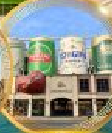
Da Bao Island