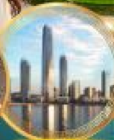
เมืองจีน