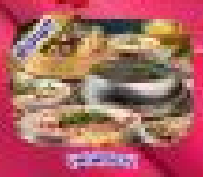
บุฟเฟ่ต์