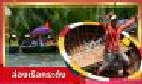
ล่องเรือทะเลฮอยอัน