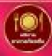
อาหารเช้า