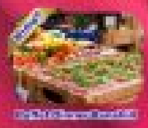
บุฟเฟ่ต์อาหารเช้า