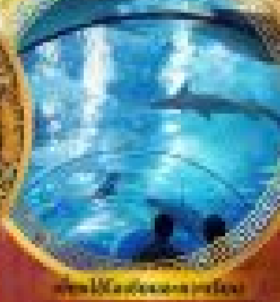
ชมโลกใต้ทะเล