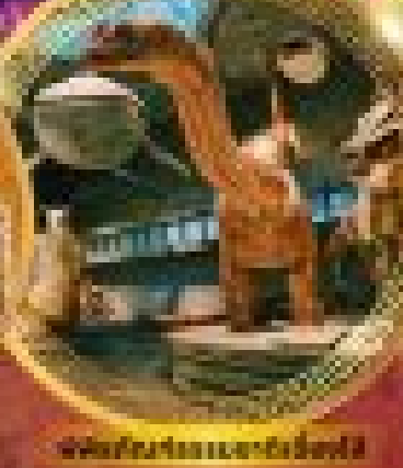
ชมพิพิธภัณฑ์วิทยาศาสตร์