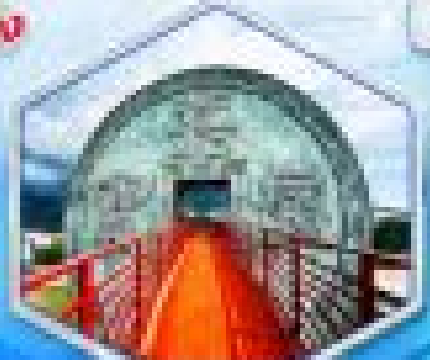
เขตกินซานหลี่โบราณ