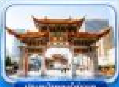
เมืองคุนหมิงโบราณ