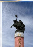
สวนสุสานเจงกิสข่าน (ชมด้านนอก)