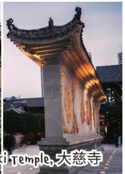
Daci Temple, 大慈寺