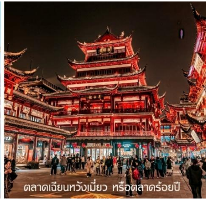
ตลาดเจียนหวงเปี้ยว หรือตลาดร้อยปี