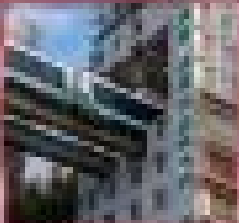
ชมตึกสูงแห่งใหม่