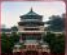
ชมวัดโบราณ