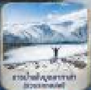
ลานโกลด์ฮิลเลอร์ (Gold Hill)