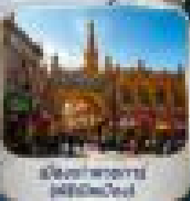
เมืองโบราณ (Silk Road)