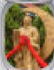
Dim Sum 100