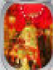
Dim Sum 100