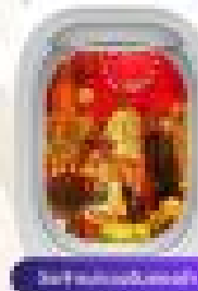
Stir-fry with vegetables