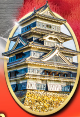
ปราสาทนัตสึโมโต้

รหัสทัวร์ RJ-VZNR004 เดินทาง 5D 3N ท.ย. - ต.ค. 69