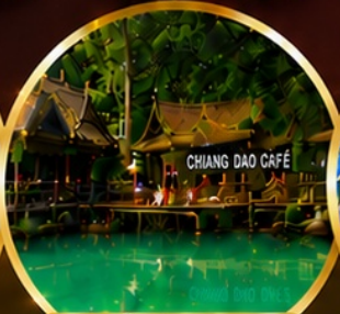
ท่าเชียงดาว