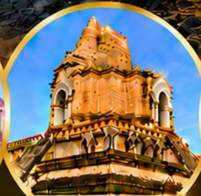
วัดเจดีย์หลวงวรวิหาร