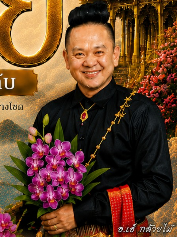
อ.เอ๋ ถวัลย์ไม้

เสริมโชคลาภ การงาน การค้า เปิดทางรวย เงินทองไหลมา