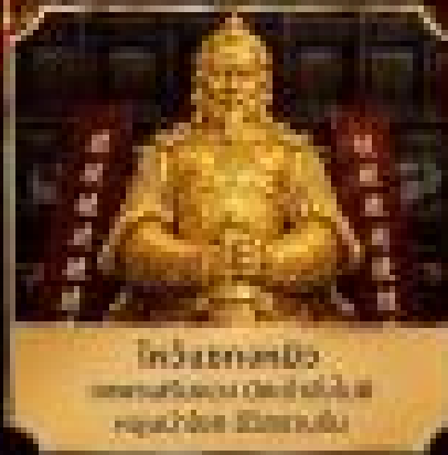
วัดพระธาตุนคร และสวนพฤกษศาสตร์เมือง