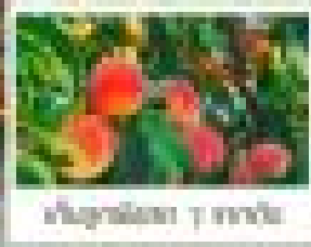
ชมซากุระ 7 ไร่