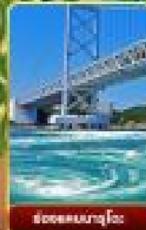
ล่องชมเมืองฟูจิ