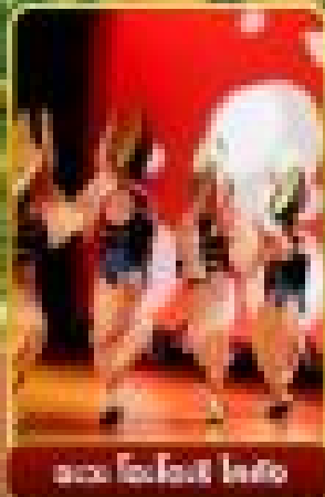
ชม โชจิโรชิ โทโฮ