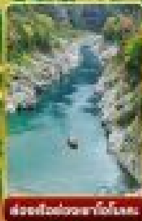
ล่องเรือชมความงามที่โอบุระ