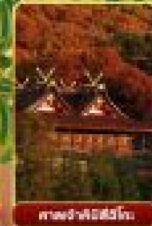
ภาพจำที่ฮิโตะโงะ

🍷 อาหารเช้า 4 คับ 📅 มนทระเปิด 23 ชม x2 🌞 8Days 5Night