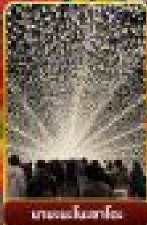
มาบะระโนะฮะโตะ