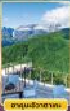
อุทยานฮิวาฮากะ