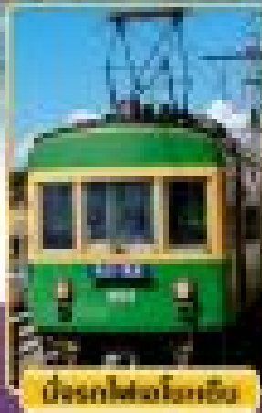
บริการรถไฟโทโฮริ