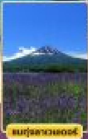
สวนทุ่งลาเวนเดอร์