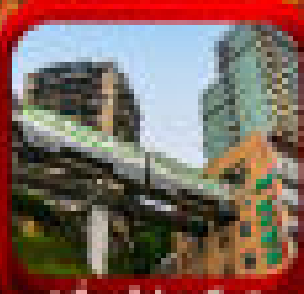
* เมืองฟ้าฟุ้ง *