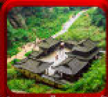
* อุทยานหลุมฟ้าสะพานสวรรค์ *