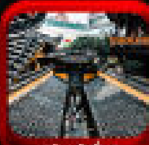
* สันตอ๋อ *