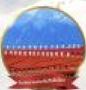
เมืองโบราณยี่หนาน