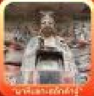
"วัดเขาค้อ"

บึงตรงของช้าง - อุ้มหลอง ค้างคาว อุทยานเขาบางฟ้า อุทยานเขาค้อ - อุทยานเขาค้อ - อุทยานเขาค้อ อุทยานเขาค้อ - อุทยานเขาค้อ - อุทยานเขาค้อ อุทยานเขาค้อ - อุทยานเขาค้อ - อุทยานเขาค้อ