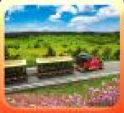
"อุทยานเขาบางฟ้า"

บึงตรงของช้าง - อุ้มหลอง ค้างคาว อุทยานเขาบางฟ้า อุทยานเขาค้อ - อุทยานเขาค้อ - อุทยานเขาค้อ อุทยานเขาค้อ - อุทยานเขาค้อ - อุทยานเขาค้อ อุทยานเขาค้อ - อุทยานเขาค้อ - อุทยานเขาค้อ