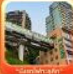
"วัดเขาค้อ"