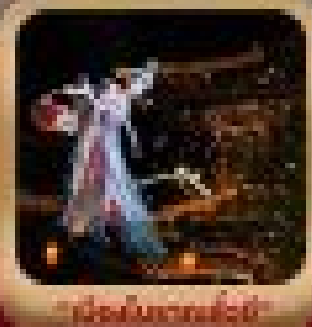
"เมืองโบราณเซี่ยงหนาน"

ชมท่าอากาศยาน มรดกโลกที่เมืองเซี่ยงหนาน • ชุมนเวียนเซี่ยงหนาน • ศาลเจ้าถงชว วัดฮงฮง • ป่าจิว • เซี่ยงหนาน • เมืองโบราณเซี่ยงหนาน • อุทยานหุบเขาชอาน เจ็ดตำนานป่าใหญ่ • ถนนวัฒนธรรมเซี่ยงหนาน • ถนนสายจีนโบราณ • ไร่ชาอูหลง