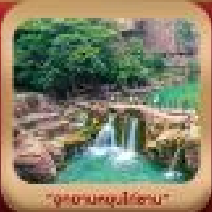
"อุทยานหุบเขาชอาน"