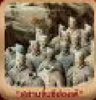
"ถนนเซี่ยงหนาน"