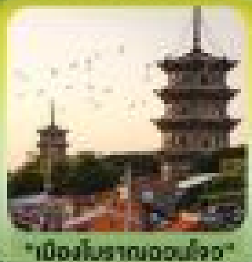
"เมืองโบราณฉงโจว"