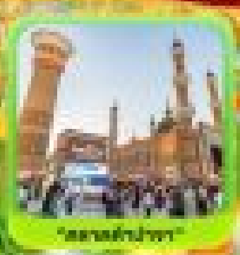
"ตลาดค้าป่างา"

รถรถไฟความเร็วสูงไทย (กรุงเทพฯ - คุนหมิง)