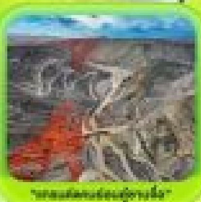
"น้ำพุร้อนทิเบตที่เมืองกุมา"

ซินเจียงเหนือ ทะเลสาบโซฮันบู น้ำตกหิมะสุดกำกวมของเอเชียกลาง - ทุ่งหญ้าขนาดใหญ่ ทุ่งดอกไม้ทิเบต - ผ่านชมสะพานเก๋วังโกว - ถนนหลวงจีนชิง - ตลาดค้าป่างา