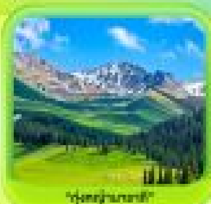
"ทุ่งหญ้าขนาดใหญ่"