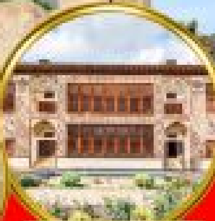
Masjed Imamzadeh Ibrahim