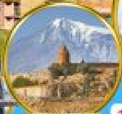
Khir Vanq Monastery