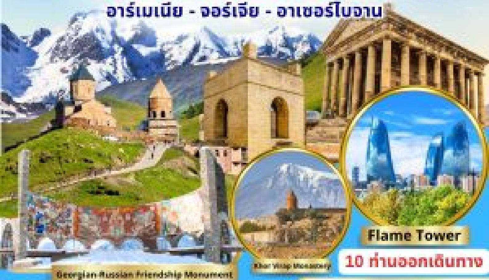
Georgian-Russian Friendship Monument