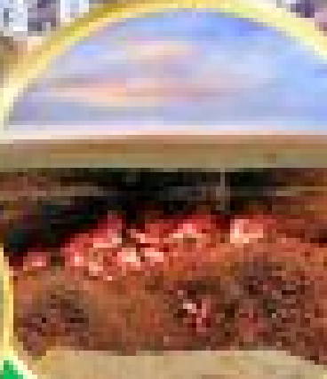
กลุ่มไฟดาร์วาซ่า