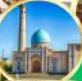
Harati Dream Complex