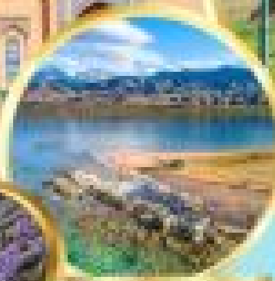
ทะเลสาบเคอลไซ