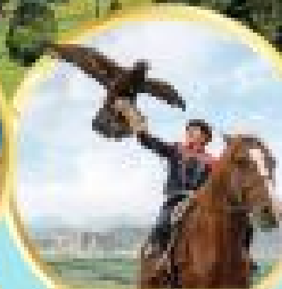
ขี่ม้าในทุ่งหญ้า