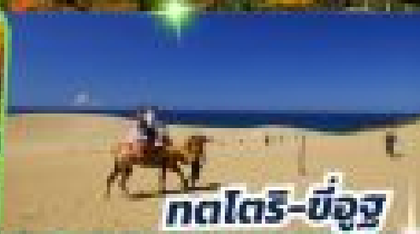
ทตโตริ-ฮังจูกุ