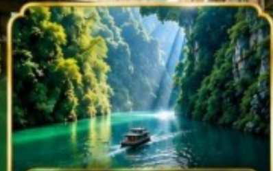
Pingshan Canyon ล่องเรือแกรนด์แคนยอนผิงซาน