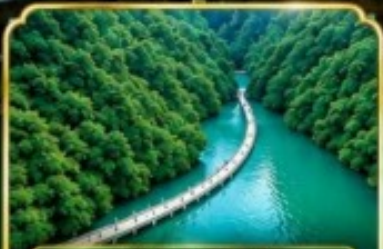
Shiziguan ด้านสิงโต ซีจื่อกวน