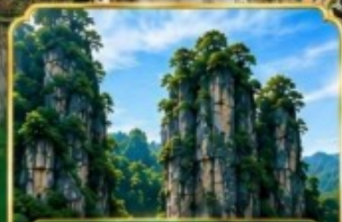
Enshi Puyan อุทยานหินเงินชือปูหย่า