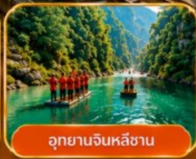
อุกยานจินหลี่ชาน