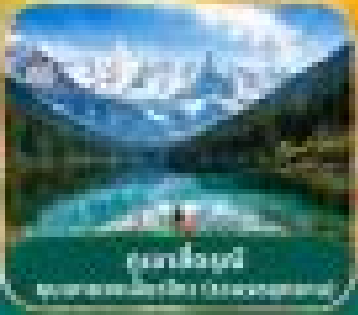
ชมทะเลสาบสีดรุณี Jiuzhaiguo