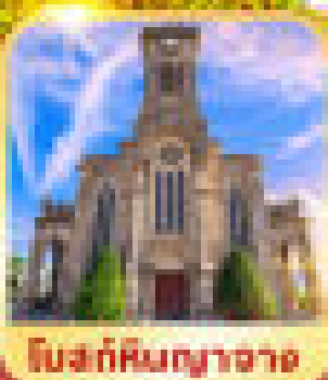
โบสถ์หินทรายขาว