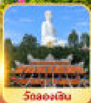
วัดอรุณจีน